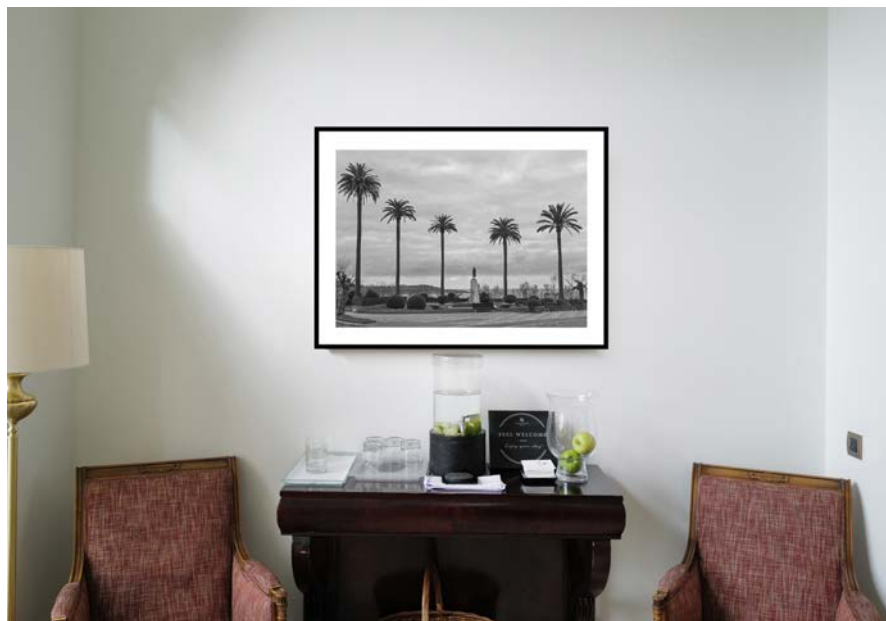
Exposición en el lobby del Hotel Real