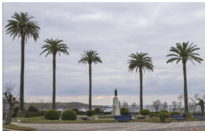
Palmeras de Santander

Al situarnos frente a las fotografías percibimos una realidad calmada, sobria y certera que no deja lugar a dudas sobre la urbe que estamos viendo. Sin embargo, es necesario agudizar el ojo para descubrir una mirada artística que trasciende lo documental hacia la búsqueda de un espacio reflexivo que apuesta por la colectividad y el bienestar ambiental. Miguel Soler-Roig se sirve de herramientas digitales para proponer, con una sutileza extrema, una nueva forma de entender los lugares públicos acorde al urbanismo verde, respirable y ajardinado, insertando palmeras imaginarias donde no las hay. Sus interferencias son mínimas, huyendo de cualquier dramatismo o escenificación forzada.