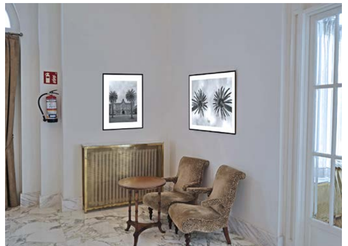
Exposición en el lobby del Hotel Real