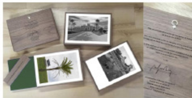
Libro y Caja/Marco de la edición limitada para coleccionistas