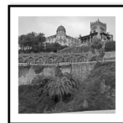
Opciones de fotografías para la edición limitada de caja de coleccionista